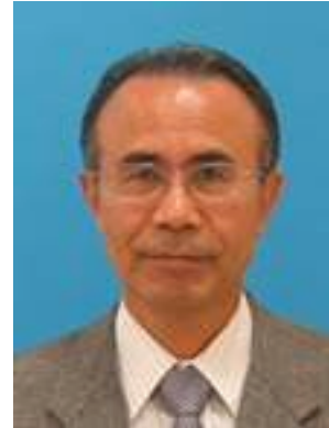
早稲田大学 名誉教授

『経営監査の理論と実務』(中央経済社)、『経営監査論』(現代出版)、『経営戦略を読む』(日本経営出版界)、『変革日本型経営』(第一法規出版)、『コーポレートベンチャリング』(ダイヤモンド社)、『ベンチャー企業の経営と支援』(日本経済新聞社)、『ベンチャーファイナンスの多様化』(日本経済新聞社)、『起業家の輩出』(日本経済新聞社)、『起業論』(日本経済新聞社)、『ベンチャー企業』(日本経済新聞社)、『会社のしくみ』(日本実業出版社)、『MOT(技術経営)入門』(日本能率協会マネジメントセンター)、『MOT アドバンス技術ベンチャー』(日本能率協会マネジメントセンター)、『ビジネスゼミナール会社の読み方』(日本経済新聞社)、『日本のイノベーション 1,2,3』(白桃書房) 他、論文多数